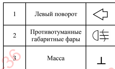
Рис.2. Схема подключения электрооборудования